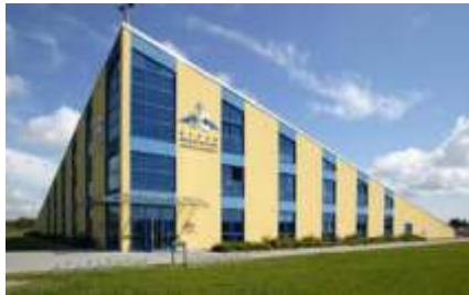
Ribnitz-Damgarten -Schaumanufaktur Ostsee- Schmuck