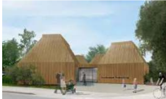
Ahrenshoop: das neue Kunstmuseum