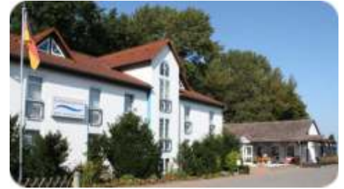
Karnin: Carmina am See (Hotel-Restaurant-Café)